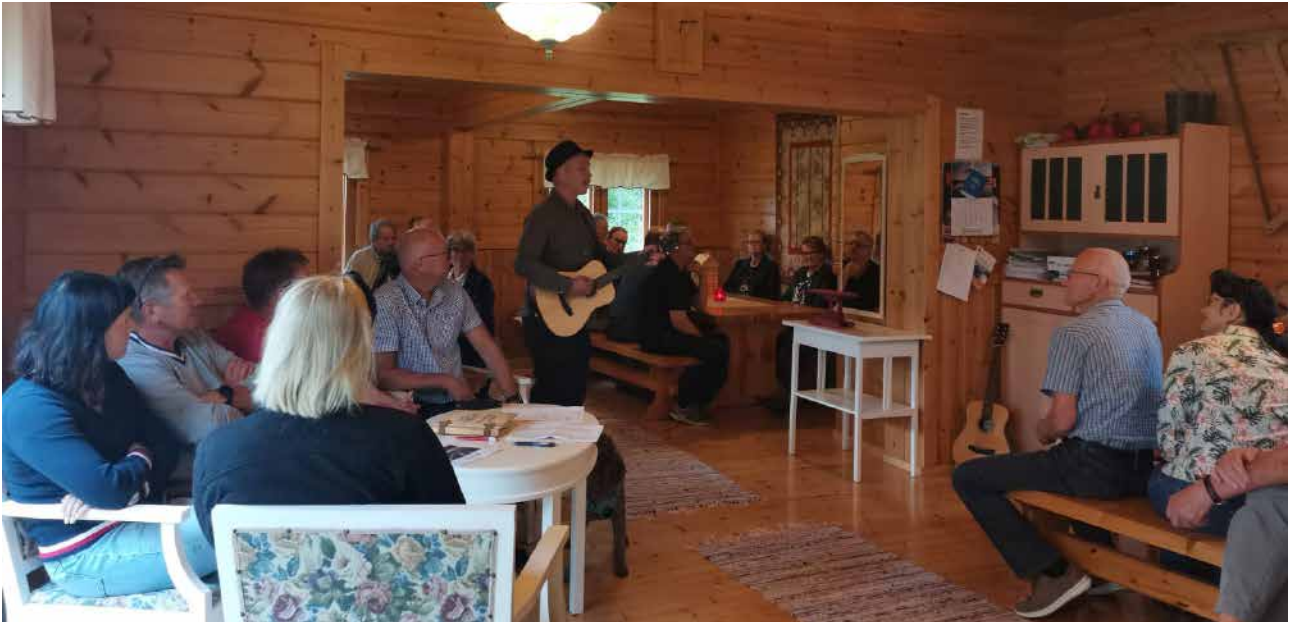
Lauluilta Sorsasalon majalla.

Pesänjako -näytelmässä. Louhosareenalla oli tällä kertaa varsin viileältä tuntuva katsomo ja lämpimät vaatteet olivat tärkeitä nyt pukeutumisessa. Toivottavasti väliajalla kahvi ja tee kuitenkin lämmittivät hieman eikä kesäflunssia tullut tältä kesäteatteriretkeltä.